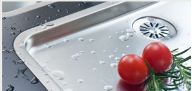
Auch der flächenbündige Einbau von Niro-Spülen ist möglich