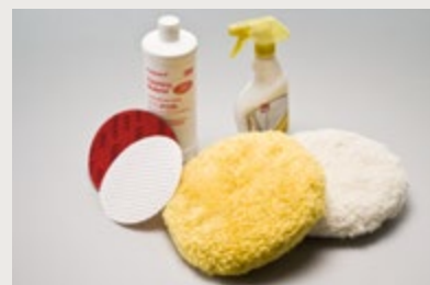
Material & Werkzeug zum Schleifen & Polieren