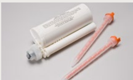
Kleber passend zu den jeweiligen Farben

Bitte beachten Sie unser Verarbeiterhandbuch oder fragen Sie einfach bei uns an. Wir beraten Sie gerne.