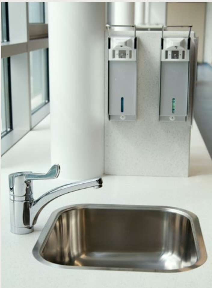
UKH Meidling, Wien

In öffentlichen Gebäuden bewähren sich flächenbündige Einbauten vor allem dort, wo Hygiene einen nicht wegzudenkenden Bestandteil darstellt, wie Krankenhäuser, Arztpraxen, Laboratorien, Seniorenwohnheime oder Pflegeheime.