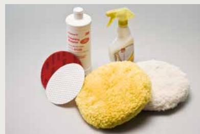
Material & Werkzeug zum Schleifen & Polieren