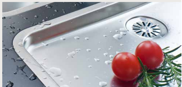
Auch der flächenbündige Einbau von Niro-Spülen ist möglich