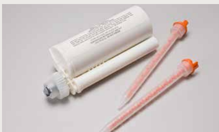
Kleber passend zu den jeweiligen Farben

Bitte beachten Sie unser Verarbeiterhandbuch oder fragen Sie einfach bei uns an. Wir beraten Sie gerne.